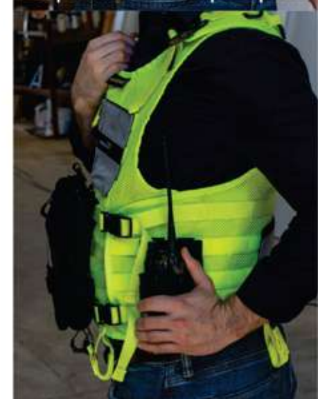
Los pouches se venden por separado