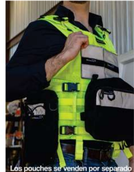
Los pouches se venden por separado